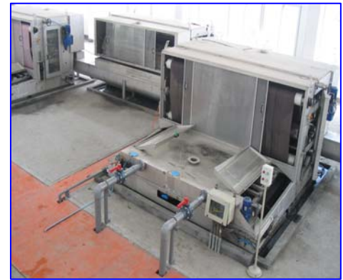
Filterre à bandes OMEGA 1300