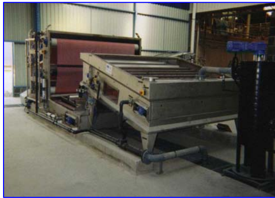
Combiné OMEGA 25-30 NG / OMEGA 1250 Version longue