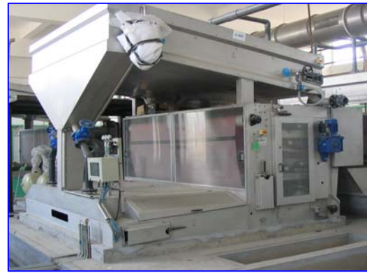
Combiné OMEGA 30-30NG / OMEGA 1300 Version haute