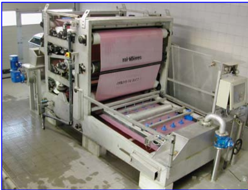
Filterre à bandes OMEGA 1150