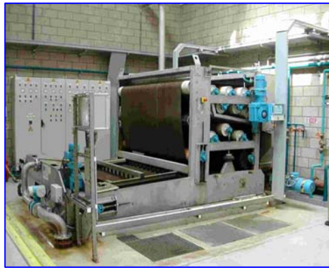
Filterre à bandes OMEGA 1200