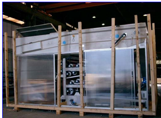
3 combinés OMEGA 25 THC / OMEGA 1250 version haute