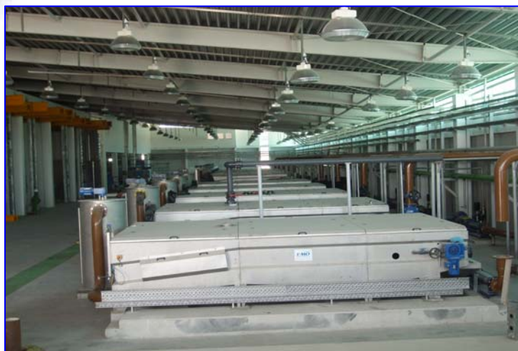
11 tables d'égouttage OMEGA 30 THC