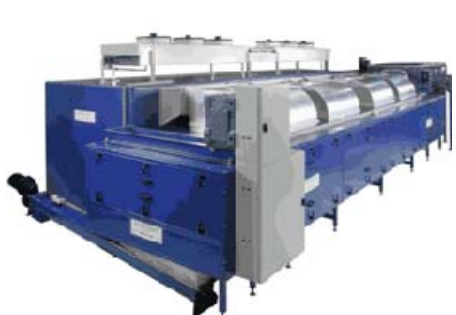
SECHAGE / SLUDGE DRYING