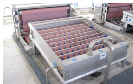
COMBINE TABLE - FILTRE A BANDES / COMBINED UNIT GBT - BFP