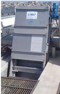
DEGRILLEUR INCLINE A CHAINE / INCLINED BAR SCREEN