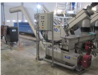
COMPACTEUR LAVEUR / SCREW WASH PRESS