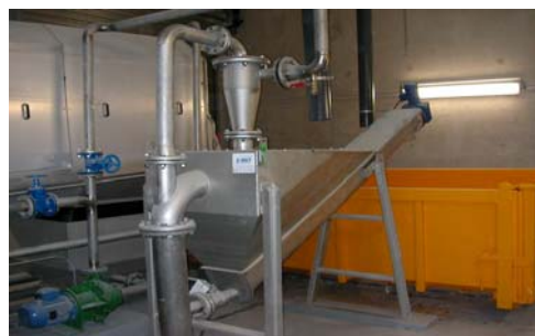
CLASSIFICATEUR DE SABLE / SAND CLASSIFIER