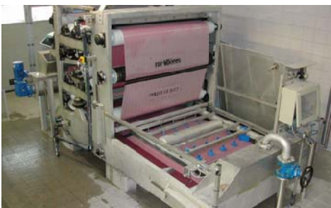
FILTRE A BANDES / BELT FILTER PRESS