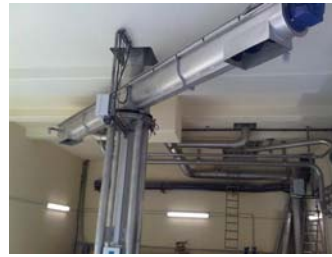
CONVOYEUR A VIS / SCREW CONVEYOR