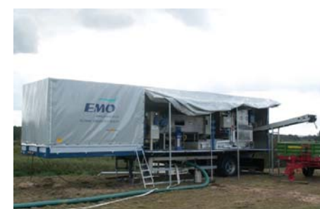
UNITE MOBILE / MOBILE UNIT