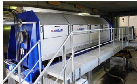
PRESSE A VIS / SCREW PRESS