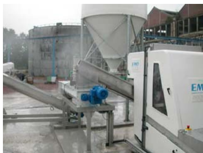
CHAULAGE / SLUDGE LIMING