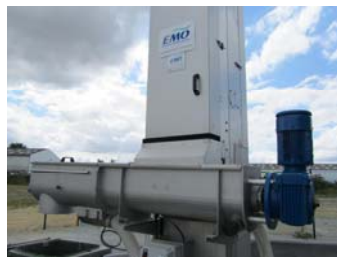
COMPACTEUR A VIS / SCREW COMPACTOR