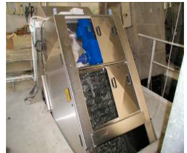
DEGRILLEUR FIN TYPE ESCALIER / FINE SCREEN STEP SCREEN TYPE