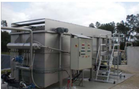
FLOTTATEUR AIR DISSOUS / DISSOLVED AIR FLOTTATION