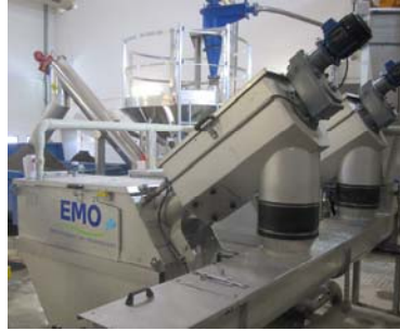
DEGRILLEUR A VIS / SPIRAL SCREEN