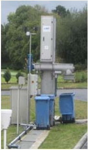
DEGRILLEUR VERTICAL A CABLES / VERTICAL CABLE SCREEN