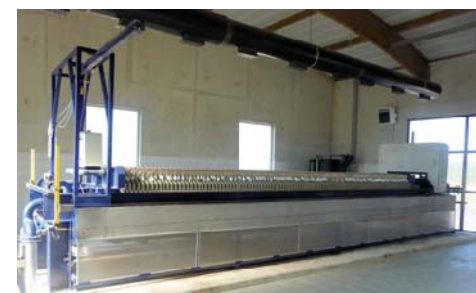
FILTRE A PLATEAUX / PLATE FILTER PRESS