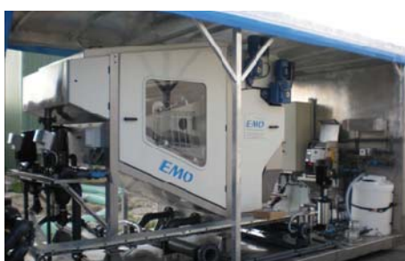
COMBINE SERIE CC / COMBINED SYSTEM CC SERIES