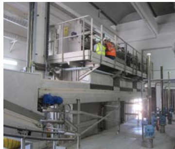
DEGRILLEUR VERTICAL TRI-CABLES / VERTICAL 3 CABLE HEAVY DUTY SCREEN