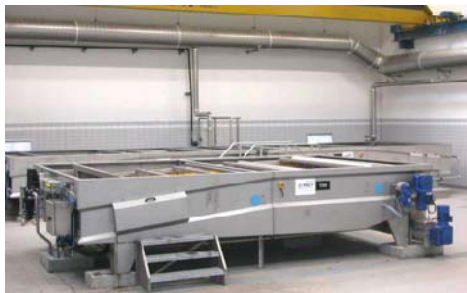
TABLE D'EGOUTTAGE / GRAVITY BELT THICKENER